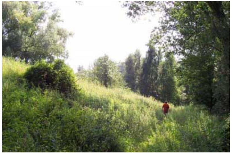
Abbildung 3 Zentrale Staudenflur mit Saumbiotopen

An Vögeln wurden für den Hamburger Raum bedeutsame Vorkommen von Sumpfrohrsänger, Nachtigall, Kuckuck und Feldschwirl gemeldet, auch Brutvorkommen von Teichhuhn, Gelbspötter, Kleinspecht und Grauschnäpper. Im Hamburger Brutvogelatlas ist aus früheren Jahren der Wachtelkönig verzeichnet. Besonderheiten unter nachgewiesenen Insektenarten finden sich u.a. mit den gefährdeten Heuschrecken Gemeine Dornschrecke und Grosse Goldschrecke, unter Tagfaltern Ländkärtchen, Kleines Wiesenvögelchen, Schwarzkolbiger Braun-Dickkopffalter und Hauhechel-Bläuling. Desweiteren wurden fünf Fledermausarten auf dem Altpüfeld gefunden, darunter Grosser Abendsegler und Braunes Langohr.