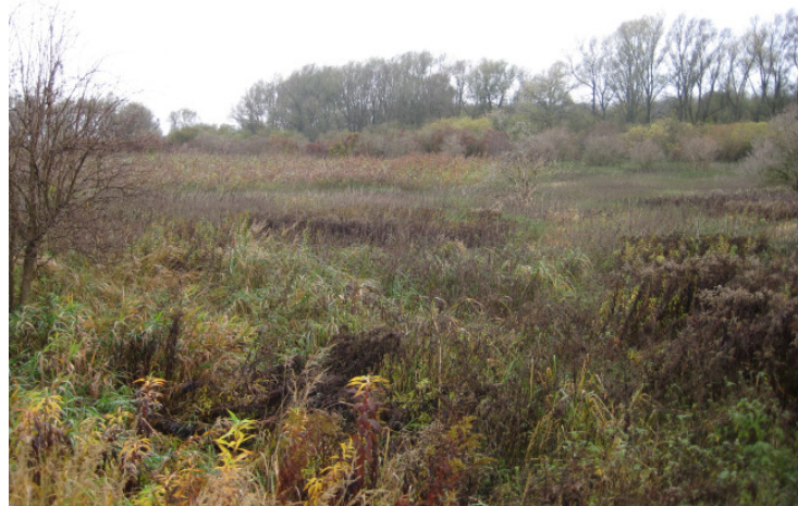
Abbildung 3 Zentrale Staudenflur mit Saumbiotopen

Verlust von Biodiversität ist ein weltweites Problem. Auch die Bundesregierung hat darauf reagiert und stellte 2007 eine nationale Biodiversitätsstrategie zum Schutze der Artenvielfalt in Deutschland vor. Sie formuliert Ziele und Massnahmen, u.a., dass für alle Flächen der öffentlichen Hand bis 2010 Konzepte zur Berücksichtigung der Biodiversitätsbelange zu entwickeln seien.