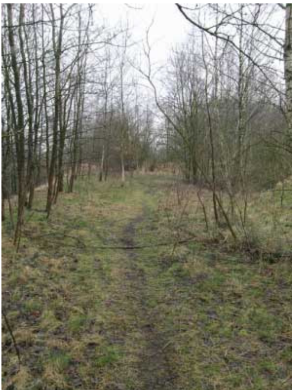
Abbildung 1 Birken-Espenwald

Das Gelände des Altspülfeldes Kirchsteinbek stellt mit über 45 nachgewiesenen Rote Liste-Arten, darunter Arten, die auch der Flora-Fauna-Habitat (FFH)- Richtlinie der EU unterliegen, einen bedeutenden Rückzugsraum für gefährdete Tier- und Pflanzenarten in Hamburg dar. 140 Pflanzenarten, über 70 Vogelarten, 6 Amphibien-, 5 Fledermausarten sowie 16 Heuschrecken- und 17 Tagfalterarten wurden dort gefunden. Biologische Artenvielfalt wird auch mit dem Fachbegriff der Biodiversität bezeichnet. Als Gründe für diese bedeutsame Ansiedlung von biologischen Arten können u.a. der Zeitraum einer 25jährigen Entwicklung, Einwanderungsmöglichkeiten aus umliegenden Räumen, aber auch zivilisatorischer Nutzungsdruck ausserhalb des Geländes und die Grösse der Geländefläche angenommen werden. Flächengrössen beeinflussen Artenzahlen von Lebensräumen. Biotoptypen des Altspülfeldes sind verschiedenen Baum- und Waldgesellschaften wie z. B. Weiden-Pionierwald und Birken-Espen-Pionierwald zuzuordnen, aber auch Gras- und Staudenfluren und Gewässern.